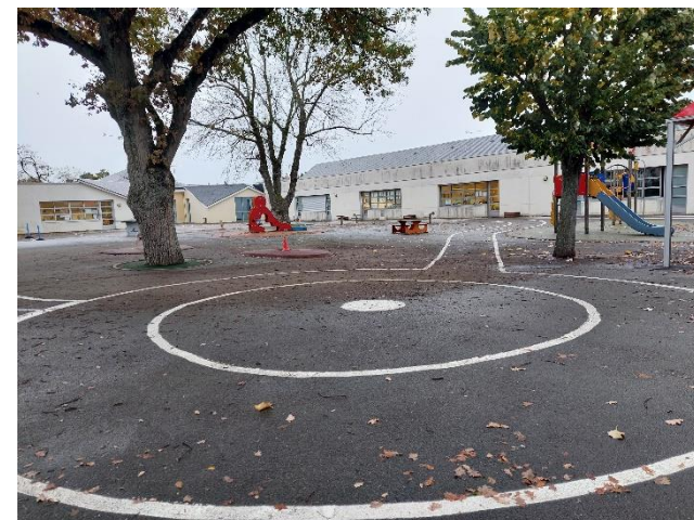
La cours des MS-GS

service environnement de Laval Agglo interviendra dans les 4 classes.